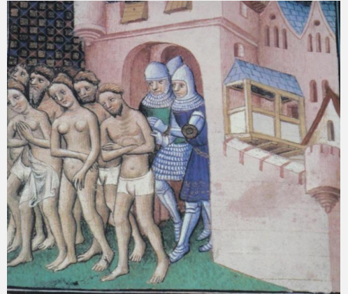
Espulsione dei Catari (Albigesi) da Carcassonne, Francia (1209)

insegnamenti e comandamenti. Le “molte acque” sulle quali questa Donna infedele siede, significano le nazioni, i popoli (Apocalisse 17:15) con i quali si è data alla prostituzione spirituale, l'infedeltà. I suoi amanti sono stati resi ubriachi dalle sue dottrine inebrianti. Falsa interpretazione, incessante manipolazione, la contraffazione delle Sacre Scritture nei secoli sono tutte azioni umane che hanno oscurato il disegno, il pensiero originale di Dio a favore dell'uomo per la sua salvezza. I capi e i dignitari del Cristianesimo romano preposti, con il loro “togli via un filo di qui, tira giù un filo di là” , ergendosi come i veri depositari e custodi della Parola rivelata, l'hanno logorata e massacrata, come hanno altrettanto realmente “massacrato” tutti i dissidenti che non la pensavano come loro. Infatti, il libro dell'Apocalisse, continuando nella sua narrazione, dice anche questo: “E vidi che quella donna era ubriaca del sangue dei santi e dei martiri di Gesù...” . (Apocalisse 17:6).